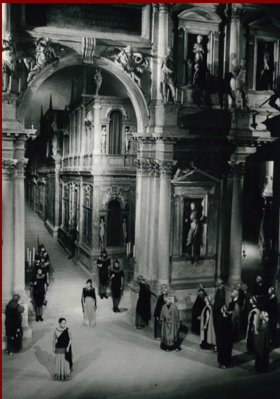
Teatro Olimpico di Vicenza, Antigone (1950)